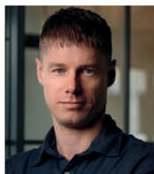
Johan Ekström Fotograf/marknadsföring

0470-132 86 0705-28 20 85 anna@maklare-bergstrand.se