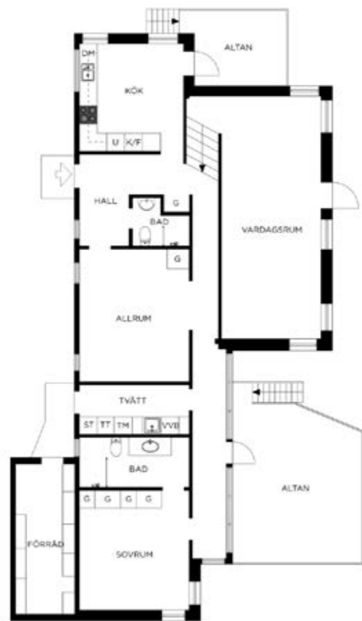
Viss avvikelse kan förekomma. Skala och mått kan avvika från verkligheten.